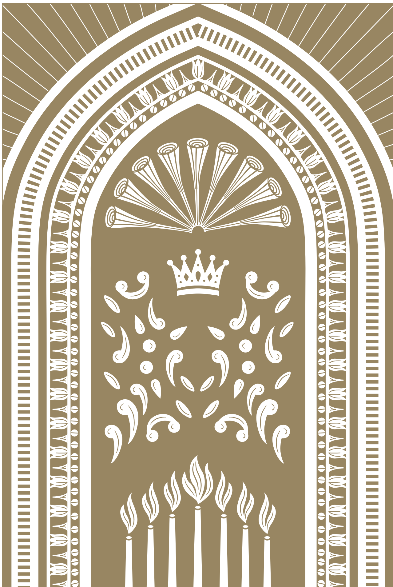
Грановитая палата – там, где развивались события в опере «Хованщина» Granovitaya palata. The place where the plot of the opera «Khovanshchina» takes place