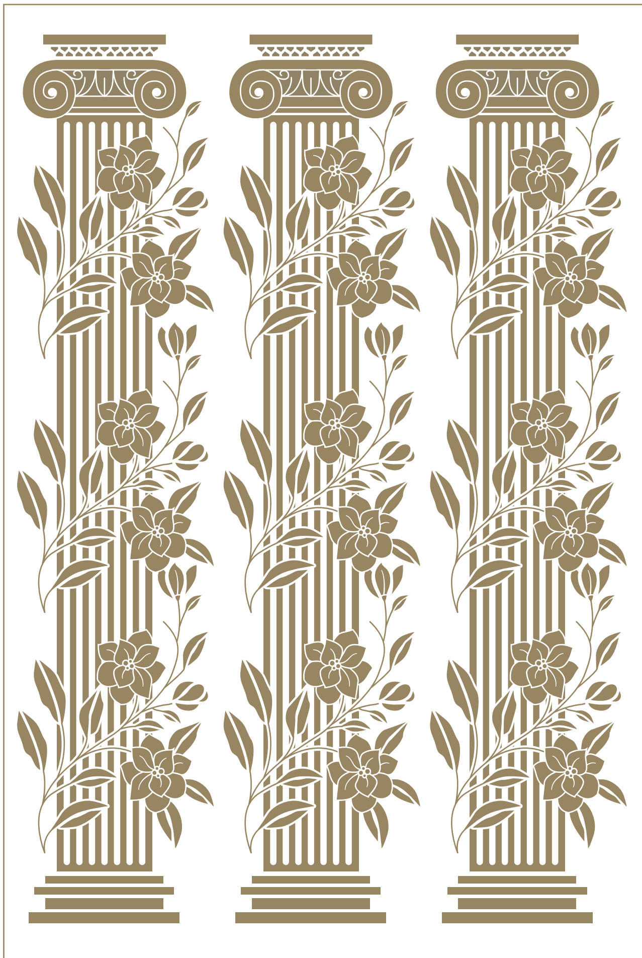
Колонны оперного театра «Ла Скала» Columns of The Teatro alla Scala