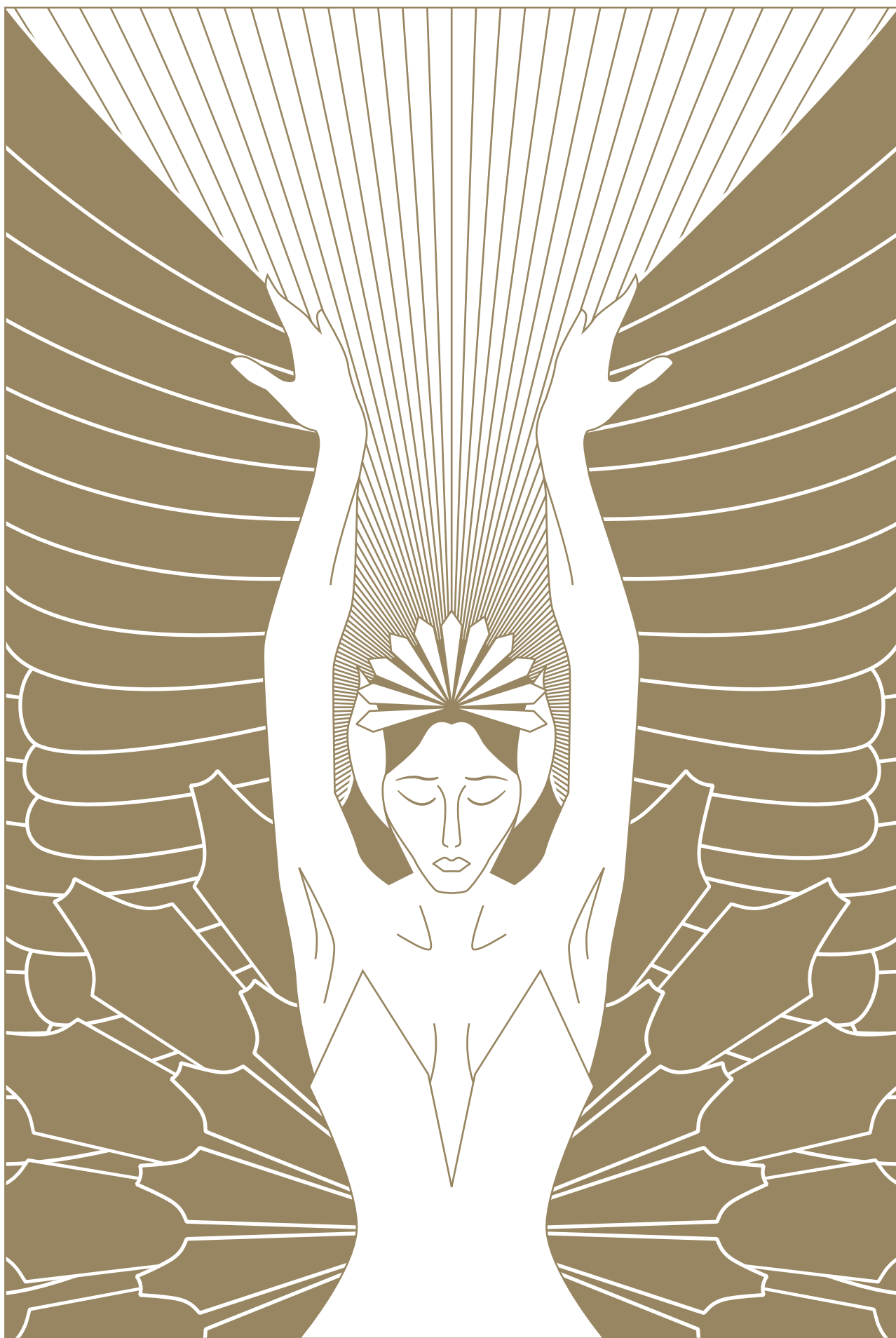
«Безумно я люблю Торнаги!» Ф. Шаляпин «I fall in love with Tornaghi!» F. Chaliapin