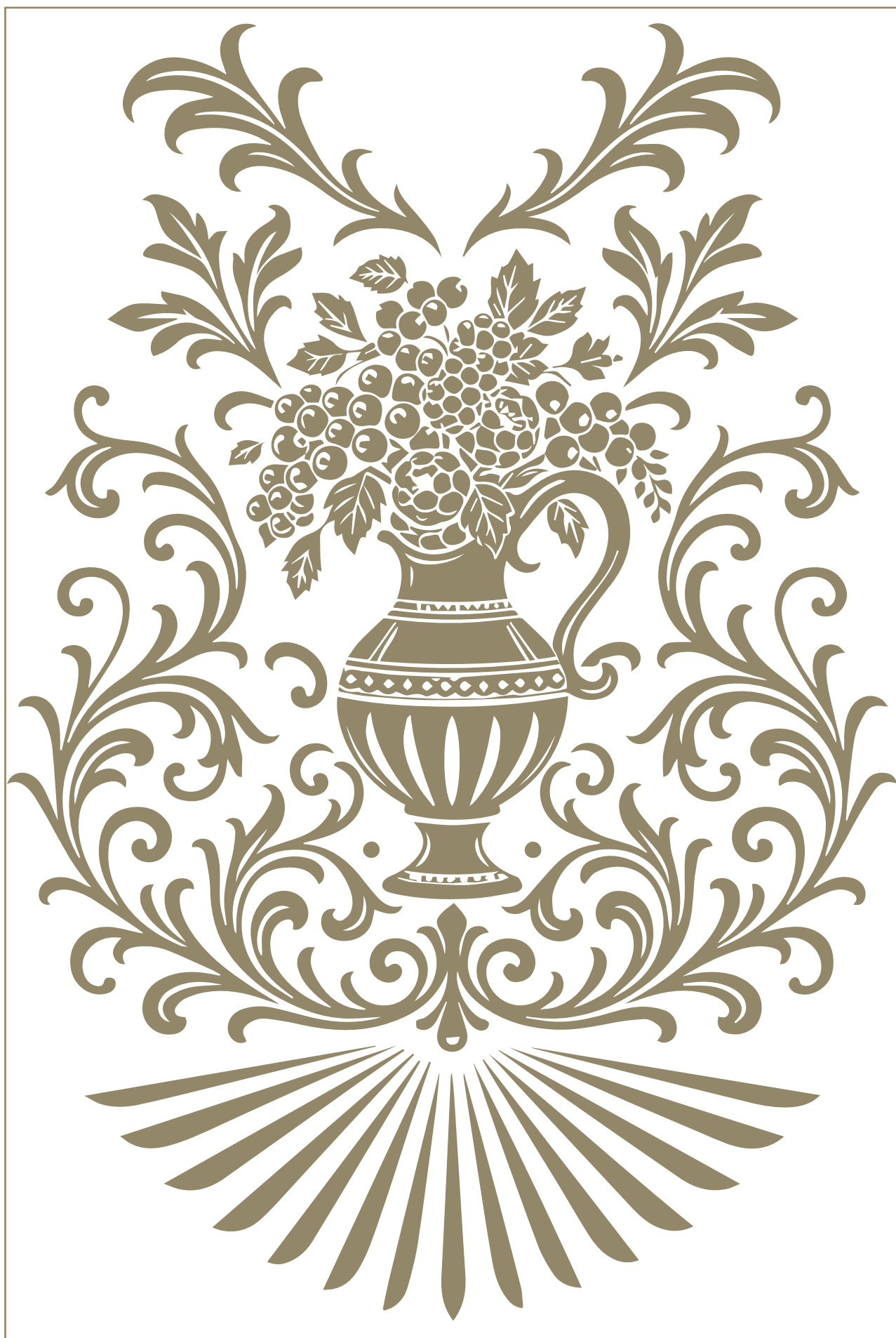
«Букет» вкусов и ароматов A "Bouquet" of flavors and aromas