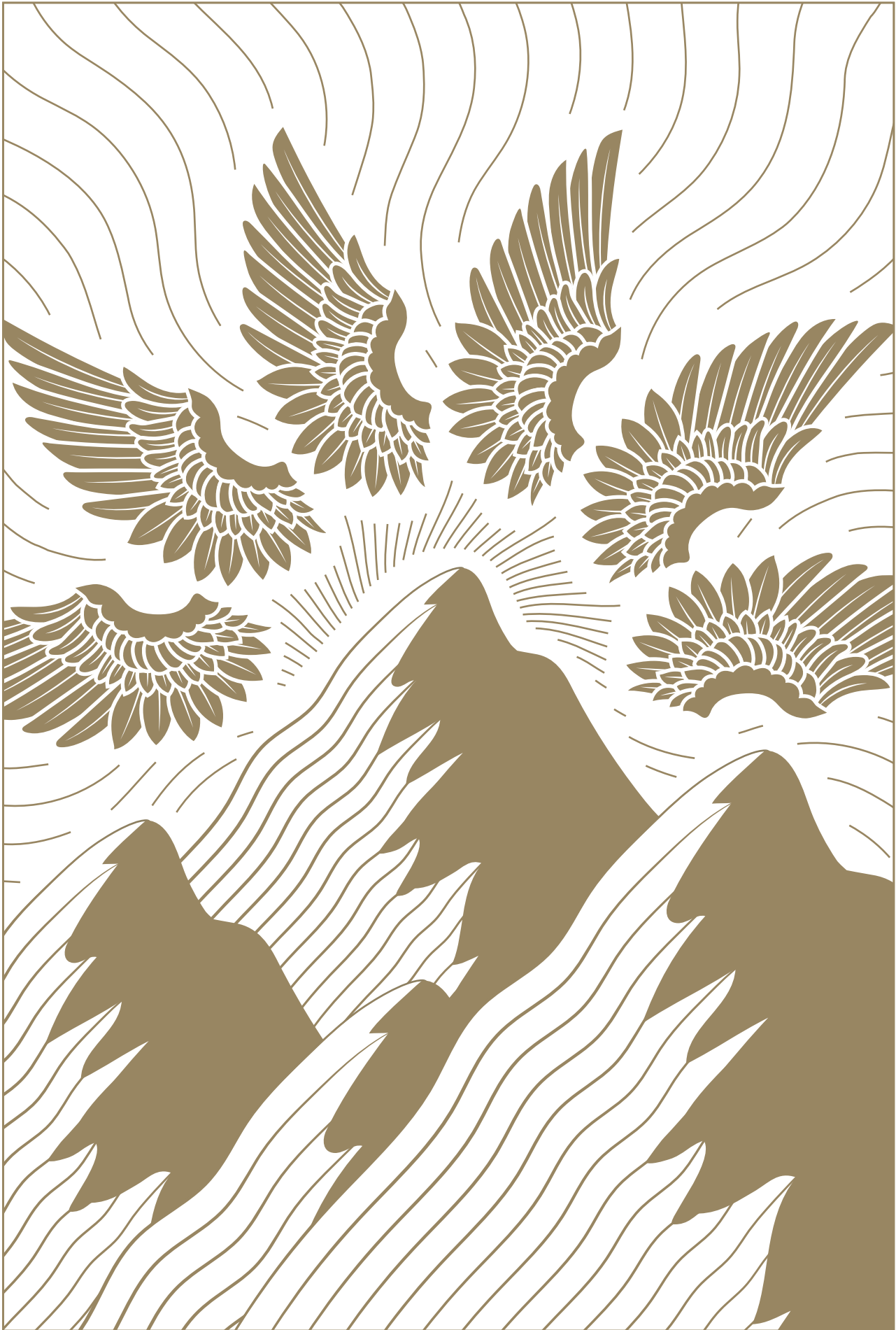
Мтацминда – святая гора в Грузии Mtatsminda is a holy mountain in Georgia