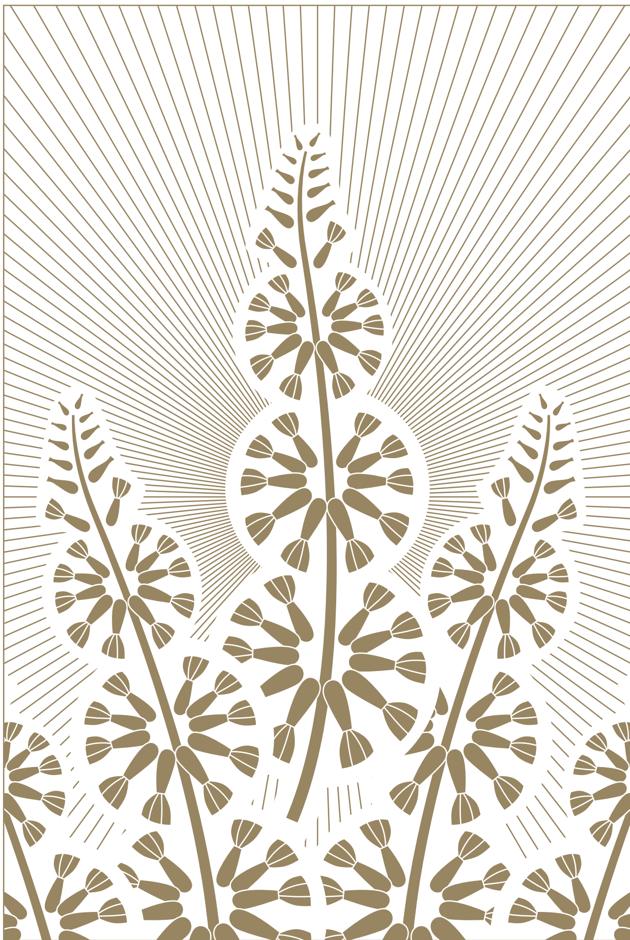
Пачули – символ богатства и процветания в делах Patchouli is a symbol of wealth and prosperity in business