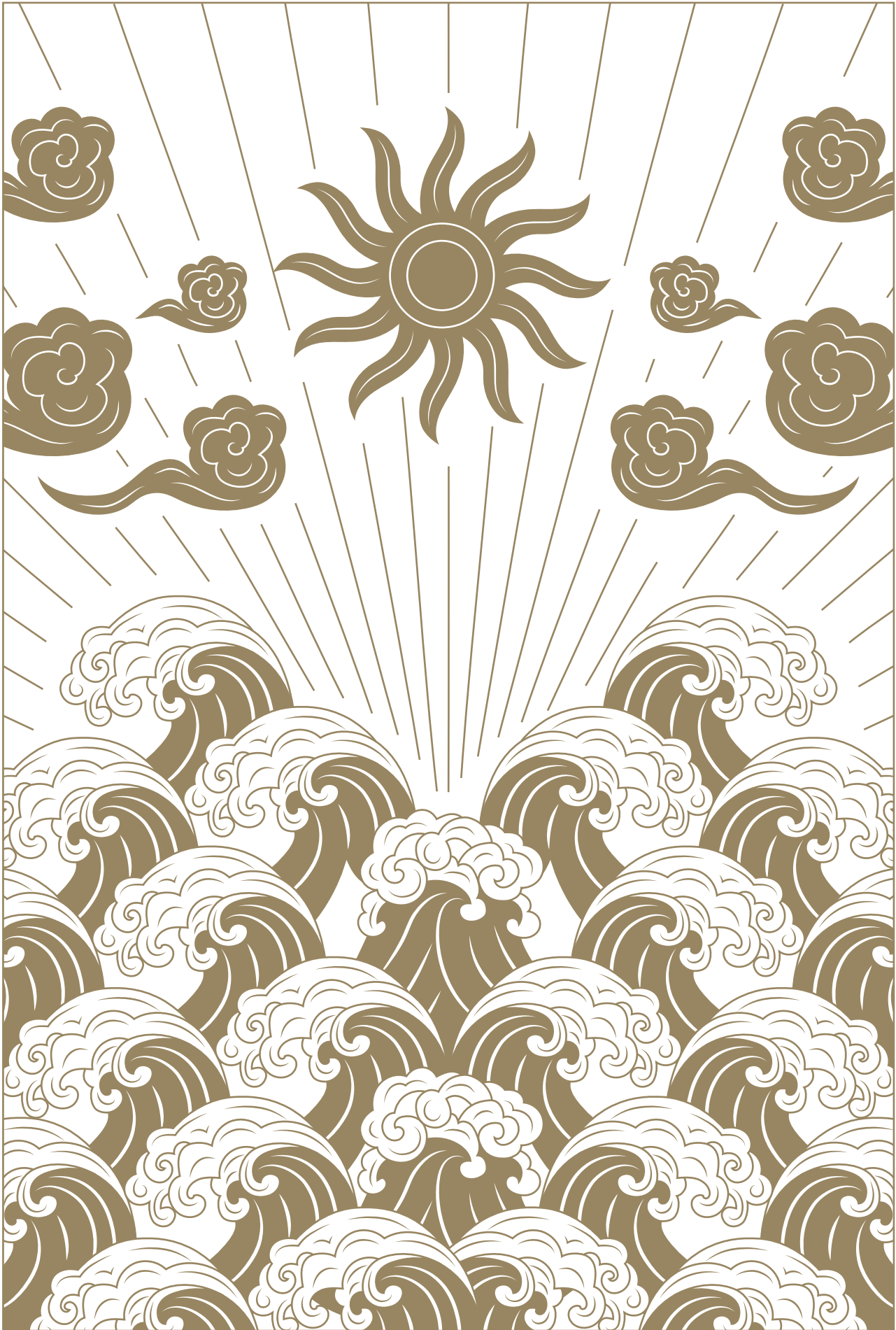
Морская пучина у мыса Сен-Барб Deep sea at Cape Saint-Barbe